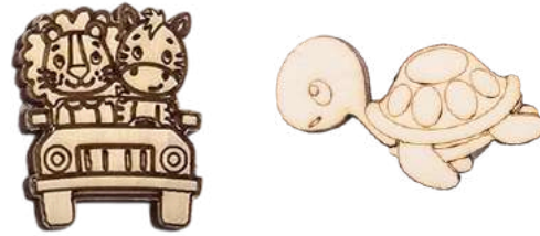
TAG IN LEGNO